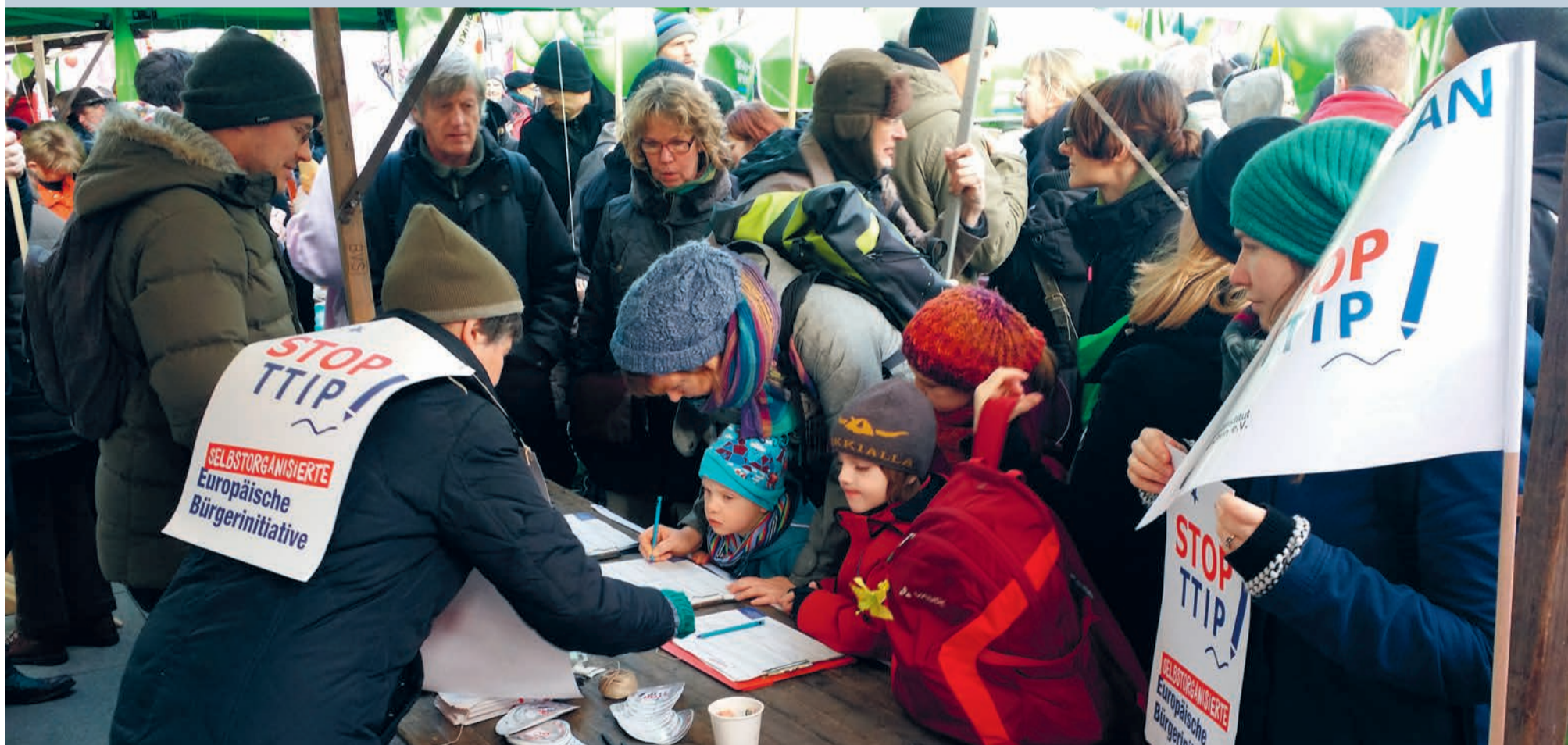
Handtekeningen ophalen tegen TTIP in Duitsland. Op 10 oktober wordt de Europese campagne, die al meer dan 2,5 miljoen handtekeningen heeft opgehaald afgesloten met manifestaties en demonstraties op veel verschillende plekken in Europa.

In deze krant gaan we verder over arbeid, boeren, klimaatbeleid en het midden- en kleinbedrijf (MKB), en niet de minst belangrijke: de rest van de wereld. Op de middenpagina's schrijven we over de groeiende campagnes en mogelijke acties, en achterop vind je allerlei handige adressen en aankondigingen.