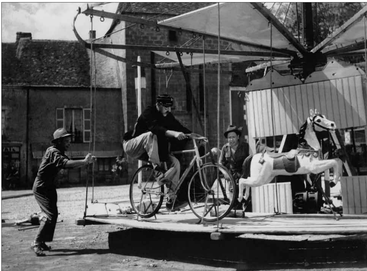
Postbode Francois fietst zich in de film Jour de Fete (Tati 1949) helemaal het lazarus als hij vreest weggeconcurrere te worden door 'Amerikaanse toestanden'.