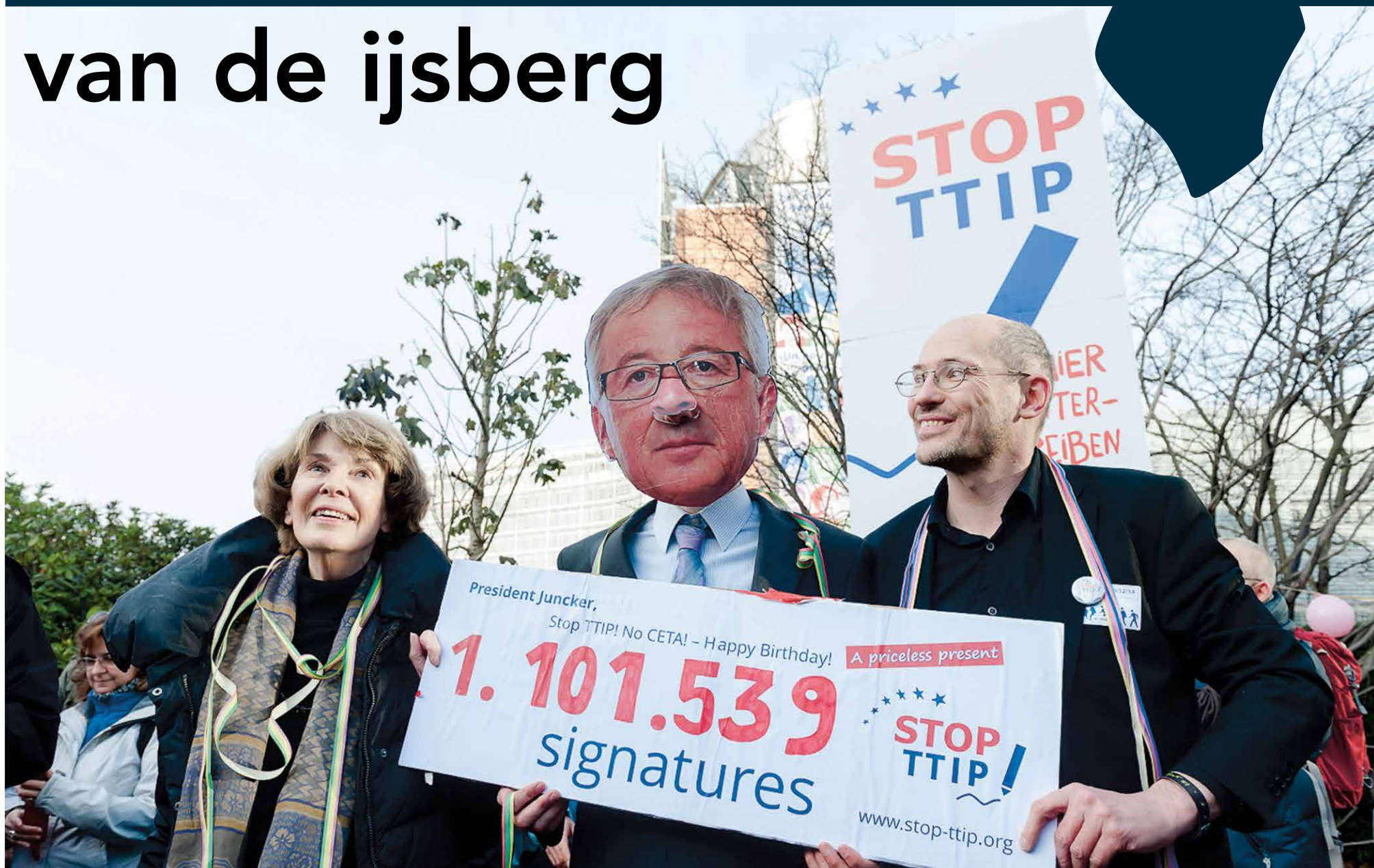
De eerste miljoen handtekeningen tegen TTIP van het "zelfgeorganiseerde burgerinitiatief" worden in december 2014 als verjaarscadeau naar EU Commissievoorzitter Juncker gebracht.