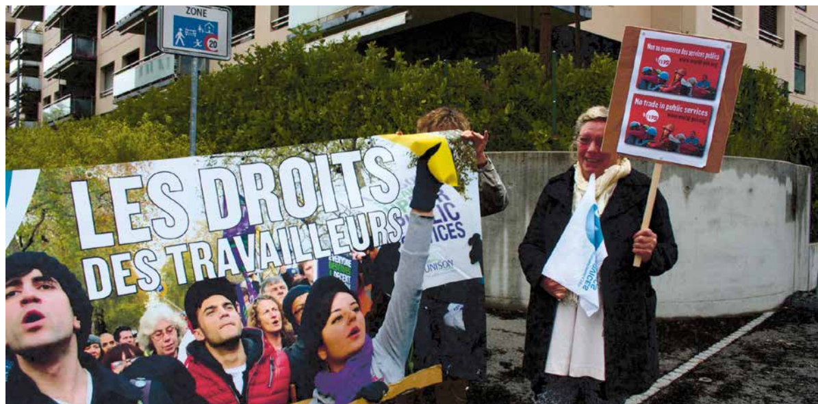
Demonstratie van PSI en Zwitserse bonden bij Australische missie in Geneve op 28 april 2014

Een internationale website met een overvloed aan informatie over dergelijke bilaterale handelsakkoorden is bilaterals.org