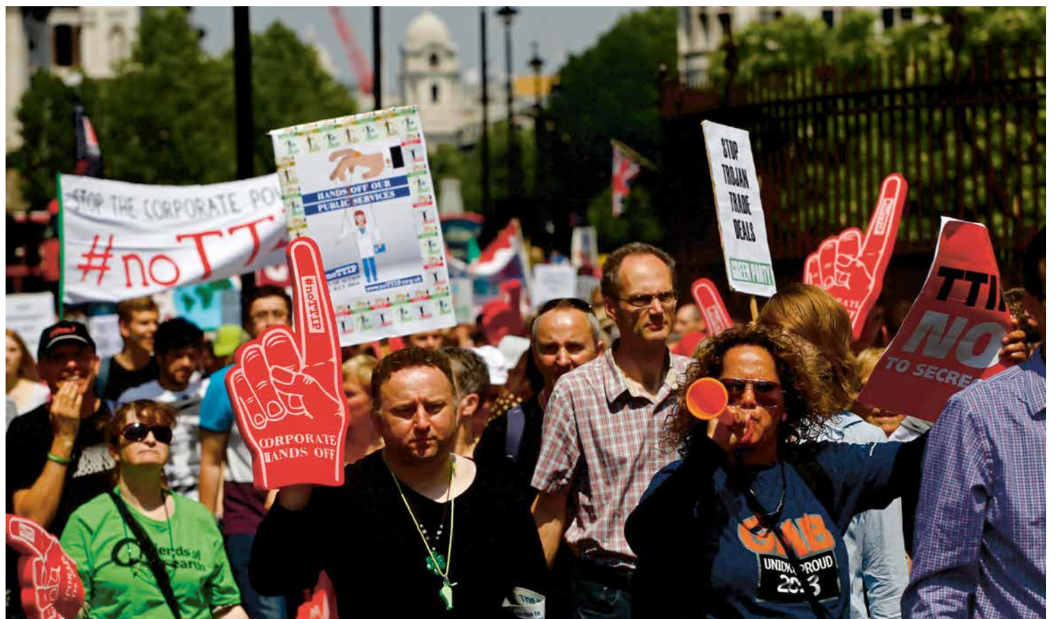
Demonstratie tegen TTIP in Londen op 12 juli 2014