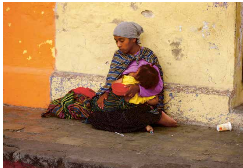
Borstvoeding in Guatemala

De toename van niet-overdraagbare aandoeningen, zoals diabetes, hart- en vaatziekten en kanker, is wereldwijd een groeiend probleem. Veel van deze aandoeningen zijn gerelateerd aan overgewicht die te maken heeft met de ingenomen voeding. Het vrijhandelsverdrag tussen de EU en de VS zal de handel in goedkoop en energierijk verwerkt voedsel en dus onze middelomtrek doen toenemen. Tegelijkertijd kent het handels-